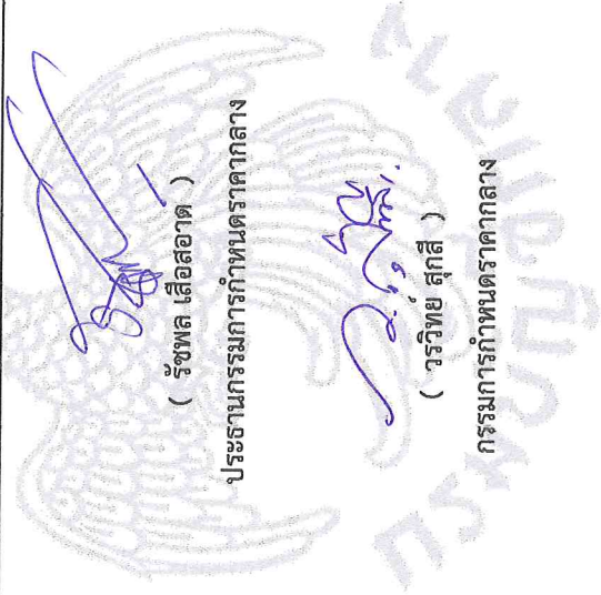
( รัชพล เสืออาด )